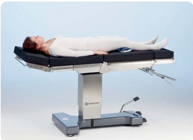
Modalità "Reverse" per chirurgia generale o ORL