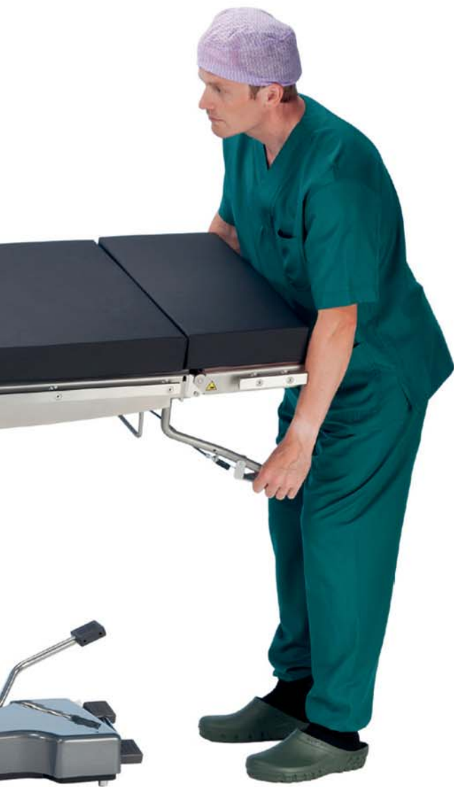
Tilt laterale assistito da pistone