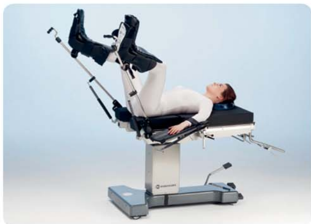
Posizione per litotomia con gambali e supporto gambe, ad esempio per chirurgia ginecologica e urologica