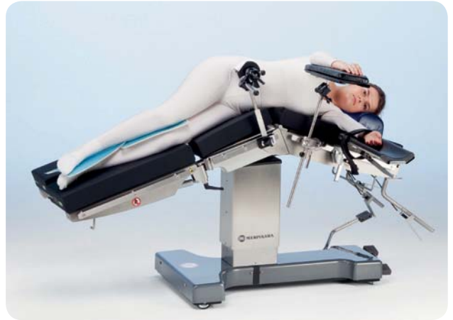
Posizione laterale per chirurgia generale senza sollevamento dei reni.