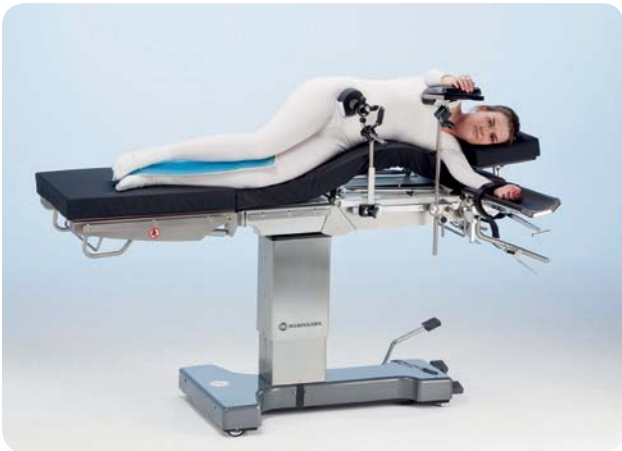
Posizione laterale con sollevamento dei reni per gli interventi a rene e torace.