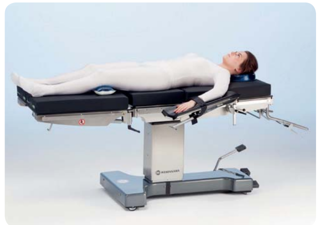
Posizione supina per chirurgia generale