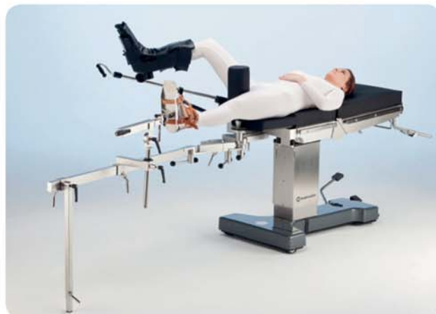
Dispositivo di trazione 19300 per chirurgia ortopedica