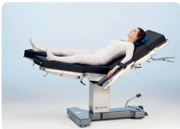
Posizione per litotomia con sezione gambe divisa, ad esempio per chirurgia laparoscopica e bariatrica